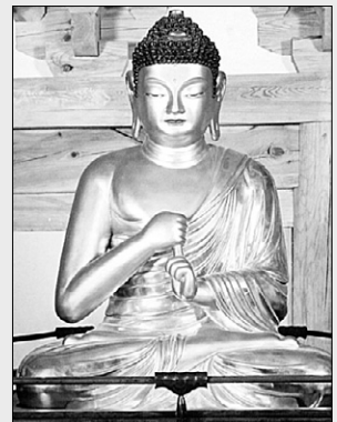
해인사 법보전 비로자나불상 <해인사 본·말사 국가 및 지방 지정 문화재 모음집> 중.

조계종 최초로 특정교구의 문화재가 한 권의 책자로 정리돼, 성보문화재 관리의 새로운 전형이 되고 있다.