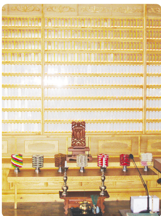
용학사 극락전 영구위패

찬덕연등에서는 KS케이블을 사용하여 가장 안전하게 전문 기술인에 의해 직접 감독 시공합니다.