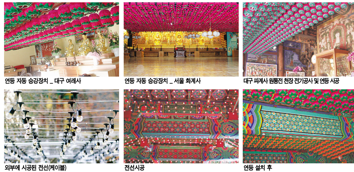
연등 자동 승강장치 _ 대구 여래사