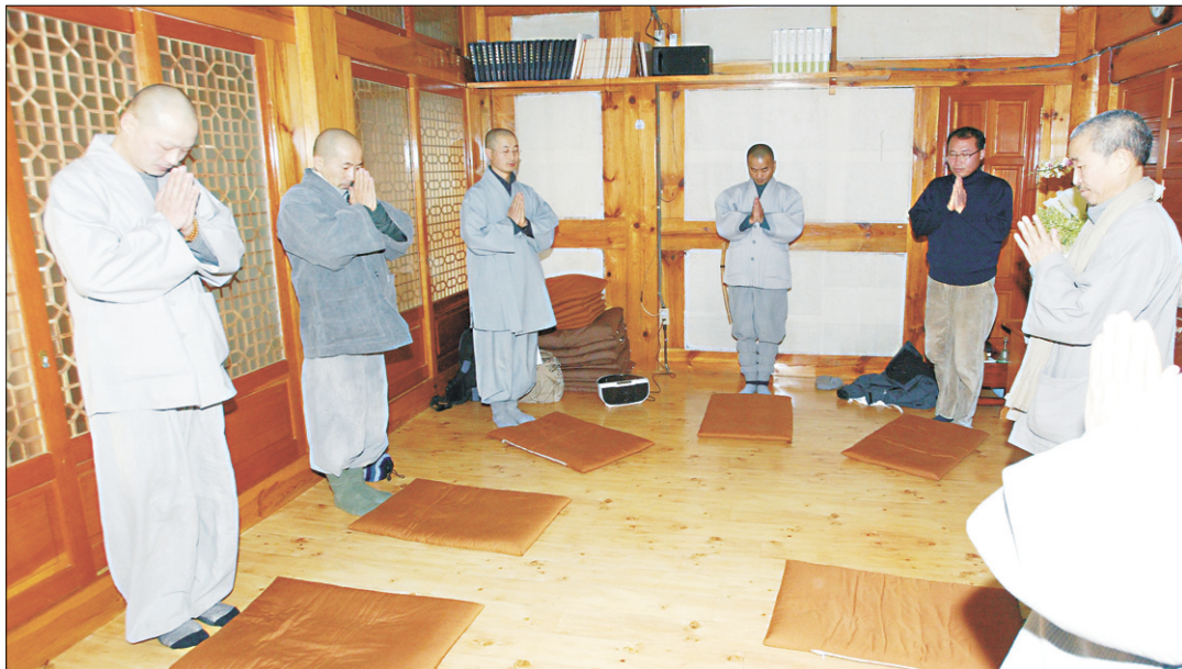
움직이는선원 대중들이 순례 출발에 앞서 '100대서원 절명상'을 올리고 있다.