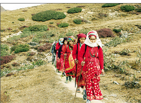
피케이 봉에서 기도하고 내려오는 현지인들.