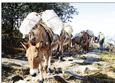
짐을 운반하는 당나귀들.