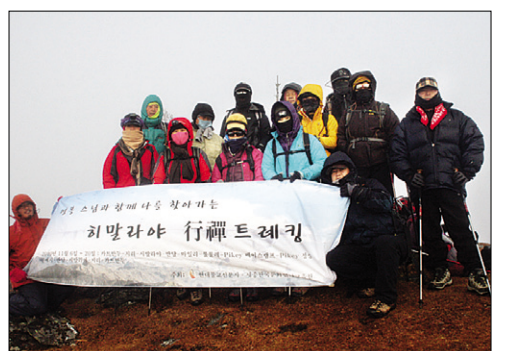
안개 속의 정상에 선 일행.