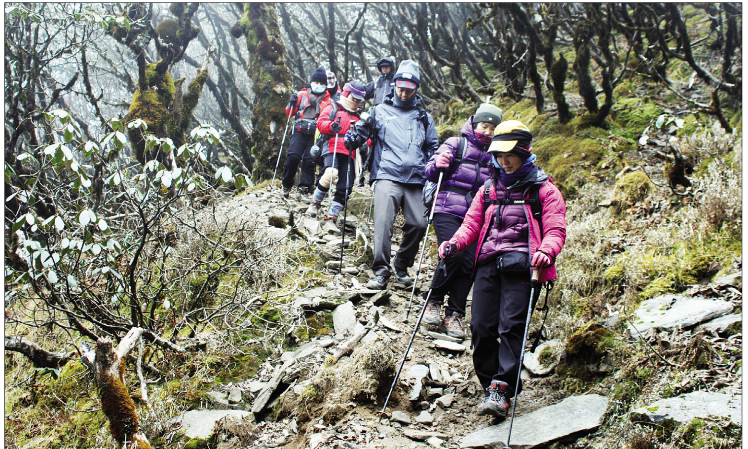
피케이 봉 하산길은 라리구라스 숲이 우거져 있다.

다. 강한 바람과 하염없는 안개뿐이었다. 그러나 앞이 보이지 않는 오리무중(五里霧中)에서 무한한 기쁨이 솟구쳤다. 일출에 대한 집착을 던져버리고 나니 마음이 환해졌다. 지금 이 순간을 위해 꼬박 5일을 걸었다는 것이 즐거웠고 안개 너머 어딘가는 밝고 영롱한 곳도 있으리라는 생각이 몸을 가볍게 했다. 산의 정상은 안개에 갇혔지만 거기 두발로 서 있는 우리는 모든 것을 환하게 볼 수 있었다.