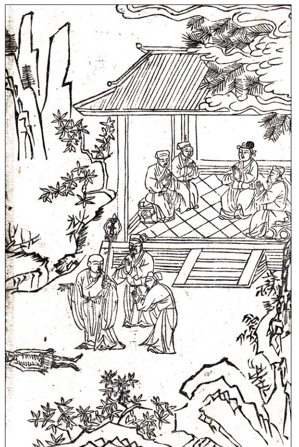
고관학박물관 소장 <석씨원류(釋氏源流)> 중 관음현화(觀音顯化) 편. 불암사 판 1673년 간행, 반곽(半郭) 27.2×18.0cm

부챗살처럼 펼쳐든 패를 읽는다 어이쿠, 박홍조씨 오셨네 엄마가 매조를 내리친다, 찰씩 경로당 화투 치나? 엄마의 재촉에 에라, 어차피 효도화투인데 깍질을 남기고 알맹이를 가져온다 내가 패를 미처 뜨기도 전에 엄마는 흑짜리를 친다 따닥 새들이 찰씩 붙는다 씩솔이한 화투판 아버지 보우하사 엄마 날이네 판이 끝날 때마다 / 똥이 왔다 간다 엄마 앞에는 파란 돈이 수북하고 팔순 엄마 얼굴에 그득하게 퍼지는 홍조 사이로 / 팔공산이 떴다 깍질만 먹고 알맹이를 남긴 엄마 화투패가 갖혀지며 네 엄마 저 세상 갈 때 좋은 화투목 열 개쯤 / 판에 넣어주려던 박홍조씨 번쩍, 광을 내며 / 판에 들어온다 -박미산, <문학나무> 겨울호