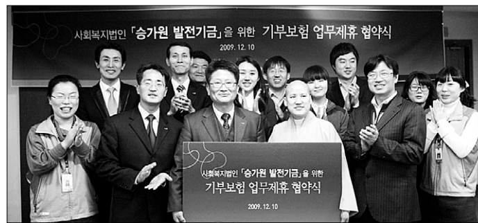
승가원과 교보생명이 승가원 발전기금을 위한 기부보험 업무제휴 협약을 맺었다.

만기 20년의 보험을 만기 시까지 납입할 경우 사망 시에 1000만원이, 만기까지 생존할 경우 305만원의 보험금이 승가원에 기부된다.