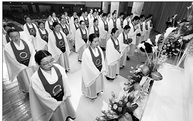
원불교 중앙총부(전북 익산)에서 원불교 새 교역자들이 출가서원식을 올리고 있다.

출가 서원자 38명은 원광대 원불교학과, 영산선학대학 4년 과정과 원불교대학원대학교와 미주선학대학원대학교 2년 과정을 수료하고 교화에 전무할 교부 35