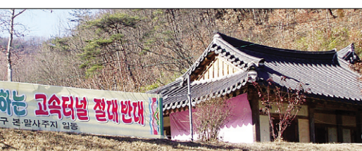
고속도로에 의해 경내지가 관통될 위기에 처한 의성 옥련사에 고속터널에 반대하는 플래카드가 걸려있다.

국토해양부 관계자는 “예비타당성 등 심의에서 문제가 없었기 때문에 상주-영덕 간 고속도로 설치할 추진하기로 했다”며 “옥련사와도 협의가 된 것으로 안다”고 밝혔다. 옥련사 측은 “몇 차례 반대공문을