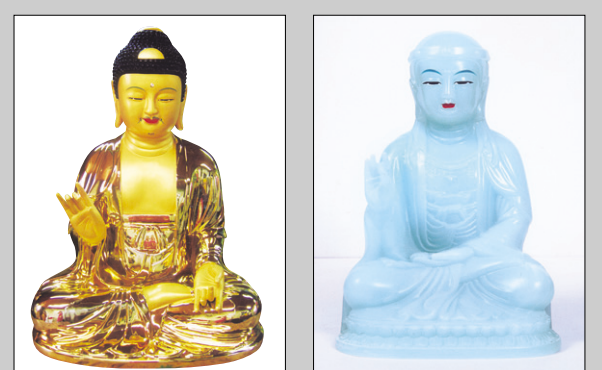
1 | 개금불 2 | 비취옥불 3 | 백옥불