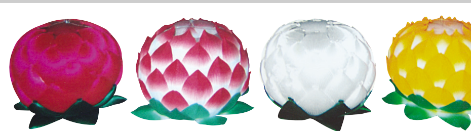
1 | 공단등 2 | 바리등 3 | 영가등 4 | 금등