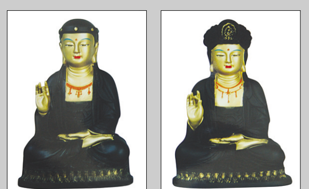
1 | 대나무숯불 2 | 대나무숯불