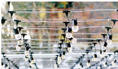
외부에 시공된 전선케이블

찬덕연등에서는 KS케이블을 사용하여 가장 안전하게 전문 기술인에 의해 직접 감독 시공합니다.