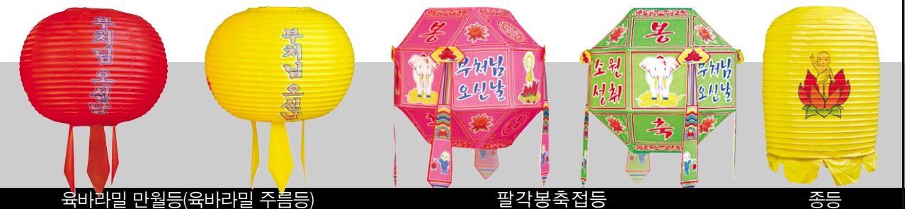
육바리말 민월등(육바리말 주름등)