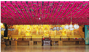
연등 자동 승강장치 _ 서울 화계사