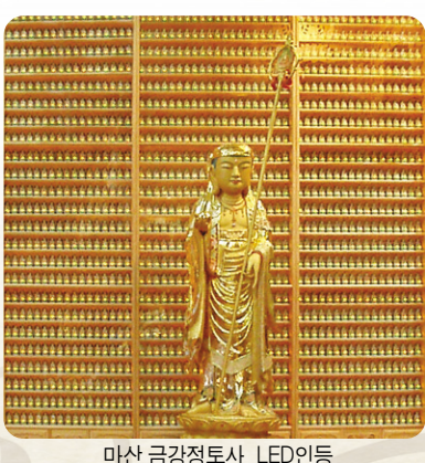
마산 금강정토사 LED인등