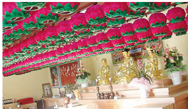
연등 자동 승강장치 _ 대구 여래사