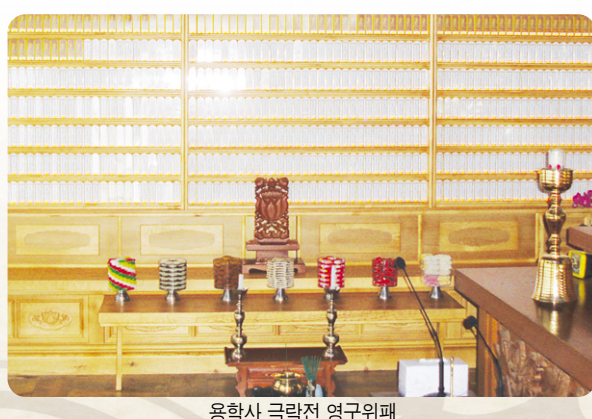
용학사 극락전 영구위패