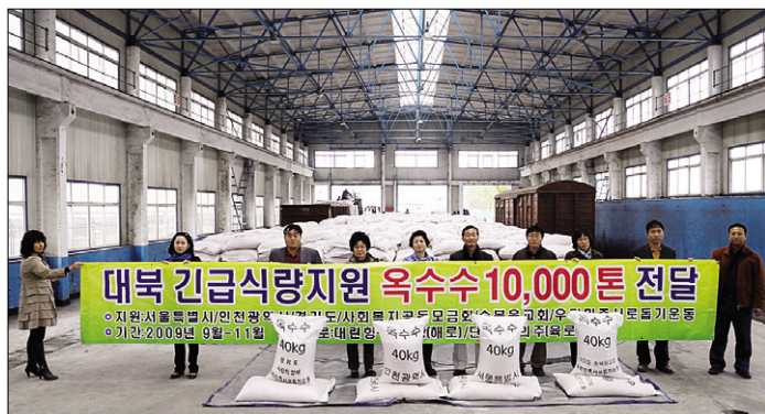
우리민족서로돕기운동이 9~11월 추진한 ‘북한돕기 캠페인’으로 총 1만톤의 옥수수를 북에 전달했다. 이는 올해 한해 민간단체지원의 원조 중 최대 규모이다.

북한이 남측 당국의 옥수수 만 톤 지원을 사실상 거부하고 있는 가운데 대북민간지원단체인 우리민족서로돕기운동(상인대표 영담)은 북한 식량난 완화를 위해 9월 이후 옥수수 1만톤을 북한에 지원했다고 12월 8일 밝혔다.