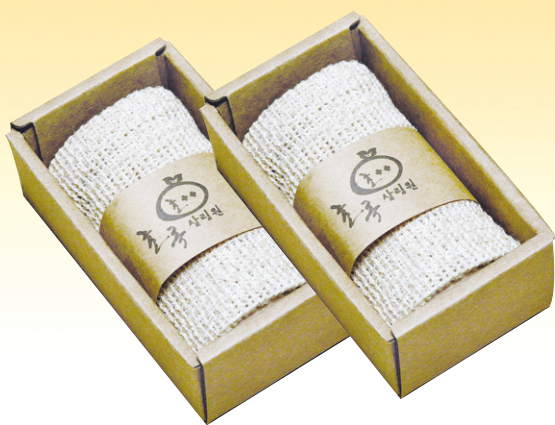
삼베웨이셀타올 - 각 6,000원