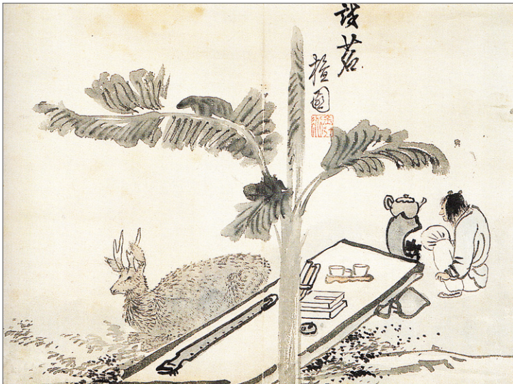
김홍도, '초원시명도', 기본담채, 37.8x28.0cm, 간송미술관 소장.

의 생활 중 필수품으로 서(書) 첩(帖) 화(畫) 지(紙) 묵(墨) 필(筆) 연(硯) 금(鑪) 향(香) 다(茶) 분완(盆玩) 등을 열거하고 있다. 조선 후기 선비들이 지닌 은자적인 삶에 대한 지향은 이러한 서재문화와 서화고동(書畫古銅) 취향과도 깊은 관련이 있다. 이후 이러한 문화는 점차 중인층에게까지 확산됐다. 18세기 시인으로 활동한 조수삼(趙秀三, 1762~1849)의 <추재기(秋齋紀異)>에는 문인의 삶을 동경한 한 중인의 일상이 묘사돼 있다. 골동품 수집으로 모든 재산을 탕진한 서울의 손 노인이 빈방에 홀로 쓸쓸히 앉아 단계석(端溪石) 벼루에 고묵(古墨)을 갈아 묵향을