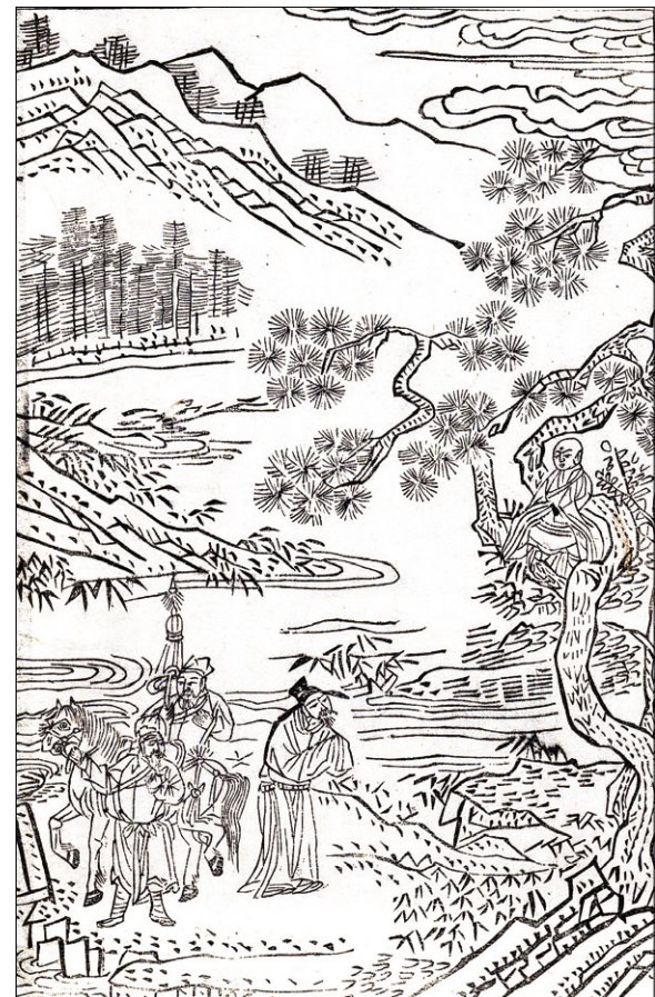
고판화박물관 소장 <석씨원류(釋氏源流)> 중 낙천참문(樂天慘聞) 편. 불암사 판 1673년 간행, 반곽(半郭) 27.2 x 18.0cm