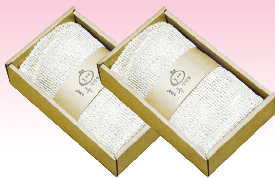
삼베사워타올 - 각 5,000원