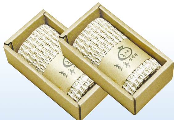
삼베수세미 - 각 4,000원