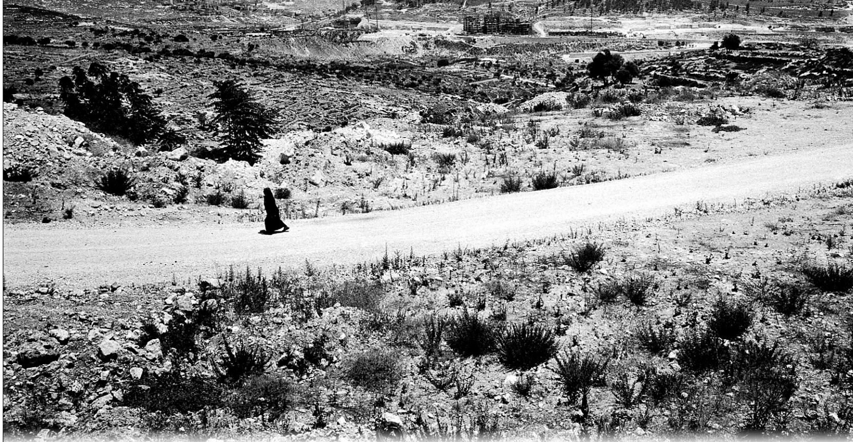
광야의 고향에서 쫓겨난 팔레스타인 여인.

박노해 시인 첫 사진전 '라 광야'展 1월 7~28일 서울 갤러리 M에서