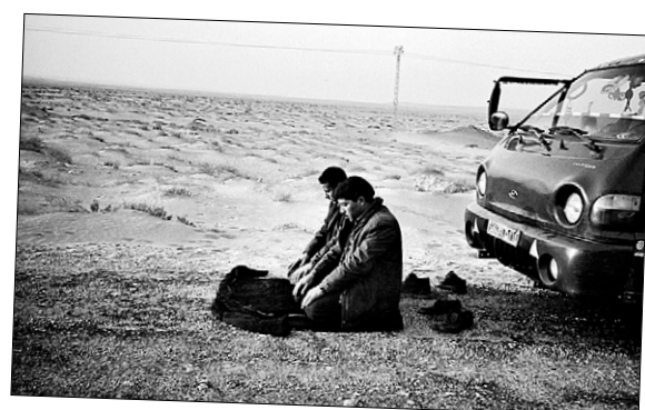
시리아 사막길에서 저녁기도를 바치는 이라크인들.