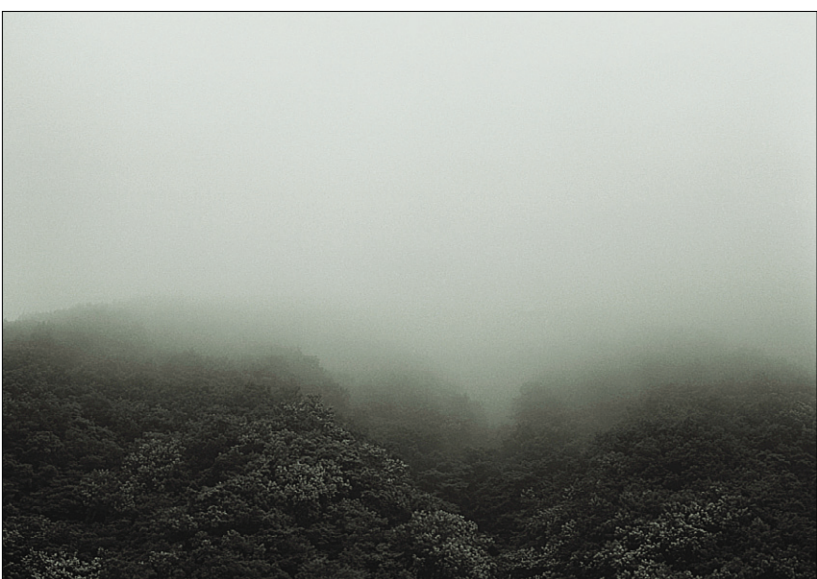
'구름이 산 아래로 내려온 날'을 주제로한 사진가 문상운의 작품.

사진가 문상운의 '구름이 산 아래로 내려온 날' 전시가 12월 3일부터 9일까지 대구 '갤러리 큐브C'에서 열렸다. 문상운의 사진 앞에 서면 '적막함과 고요 속에서 자신을 관조'하게 된다.