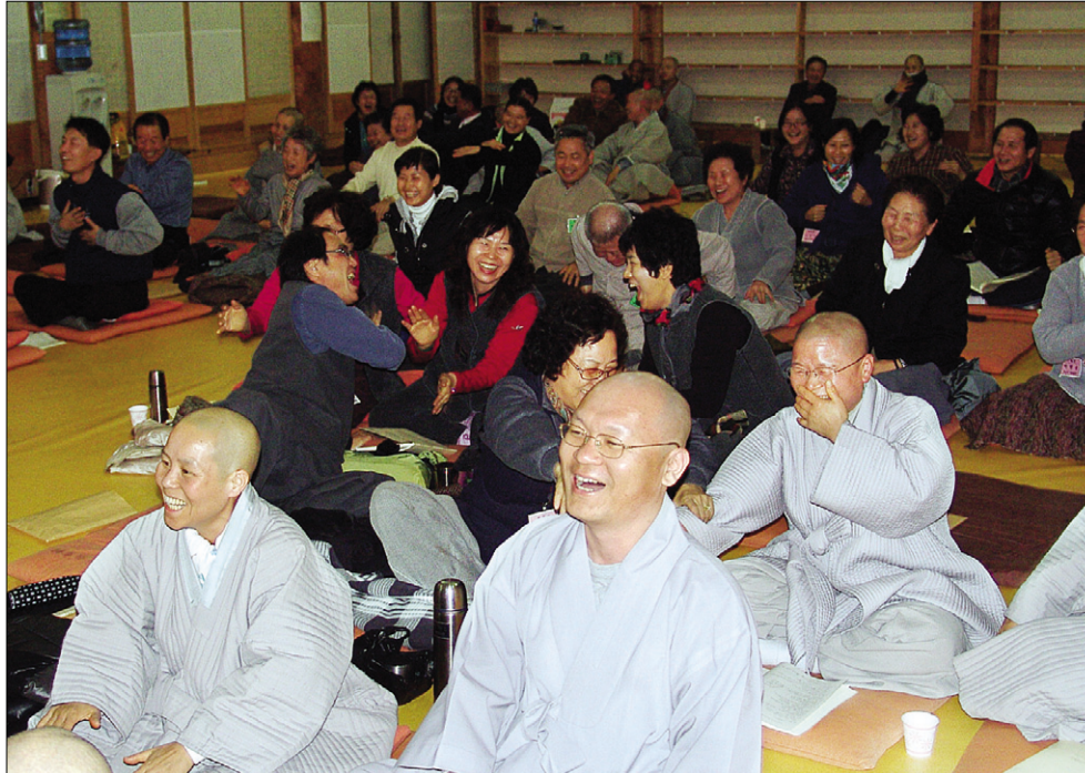
동사섭 수행의 ‘지인(至人) 3박자’ 프로그램 중 온전히 웃기로 엔돌핀을 만들어 보는 아단법석 동참자들.

아공(我空)인지라 안으로 집착할 것이 없고, 법공(法空)인지라 밖으로 집착할 것이 없다. 일체유위법(一切無爲法) 여로역여전(一切有爲法 如夢幻泡影) 如