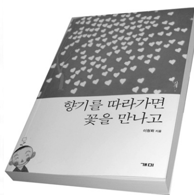
312쪽 값 12,000원

스님은 책에서 특별히 가르치거나 훈계하려 하지 않는다. 거창한 목표를 세우고 무리를 하기보다는 일상에서 부처님의 가르침을 차근차근 따라가면 "인생에 대한 바른 안목을 얻고, 인격적으로 허물없는 나를 만날 수 있다"고 말한다.