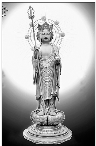
<대승대집대방광심결경> <지장시왕경> 등을 들었다.

<대승대집지장심결경> 서품에는 “만약 여러 유정(有情)이 굶주림에 핍박당하거나 의복, 의약, 침상과 이불 등 생활도구가 모자라도 지극한 마음으로 지장보살의 명호를 부르면 원하는 바가 모두 만족될 것이다”라는 구절이 있다.