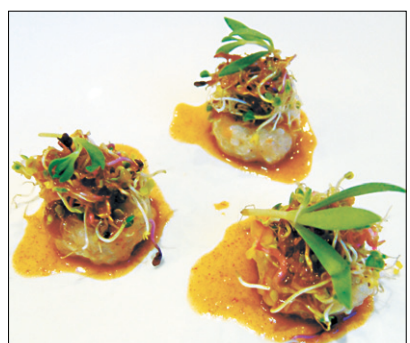
자연요리연구가인 임 거사가 인근 풀을 이용해 만든 음식

쉽 없이 떠나는 길 위에서 그는 그렇게 자연과 음식과 사람들 속에서 새로운 이야기