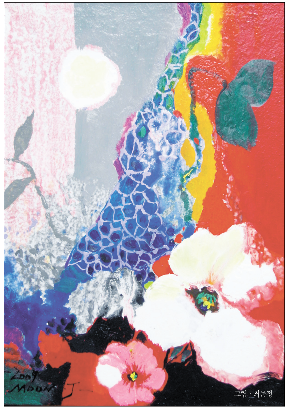
그림 · 최문정

그러나 1년 뒤, 해인사 대중들은 일타를 그대로 두지 않았다. 성철의 묵인 하에 해인사 주지로 선출하여 버렸다. 해암이 주지를 그만 두고 다시 공백이 생긴 1971년도의 일이었다. 그때 일타는 즉시 백련암으로