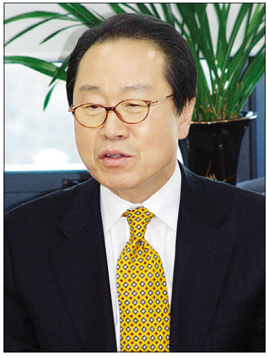
요즘 “불교와 사진 생각만 한다”는 이상벽씨.

이웃집 아저씨 같은 외모에 구수하고 재치 있는 입담으로 온 국민을 울고 웃게 했던 국민MC 이상벽(63. 4년여의 긴 공백에도 녹슬지 않은 입담으로 부처님 이야기를 온 누리 화장세계로 장엄하기 위해 나섰다. 방송계를 떠나 사진작품 활동에만 몰두하던 그가 btn 불교TV '이상벽 이야기쇼 붓다야 붓다야'로 방송에 복귀했다.