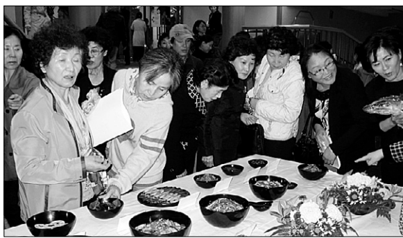
참가자들이 세미나와 함께 열린 전통사찰음식 전시를 유심히 살펴보고 있다.