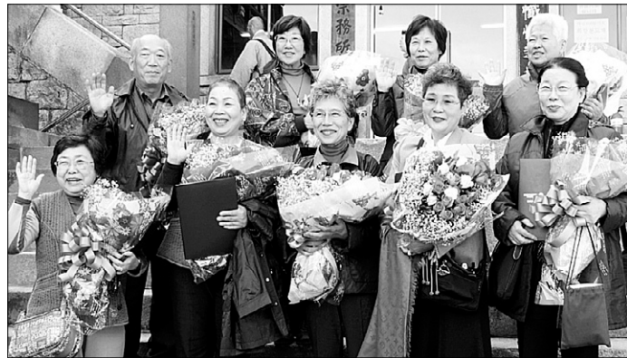
33관음성지를 모두 순례한 일본 순례객들이 11월 11일 서울 도선사에서 열린 기념식에 참석했다.

'한국33관음성지순례'는 2008년 한국불교문화사업단(단장 종훈)과 한국관광공사(사장 이창)가 기획한