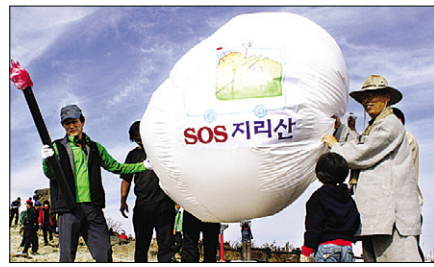
지리산불교연대준비위원회가 천왕봉에서 ‘SOS지리산’ 퍼포먼스를 진행했다.

지리산불교연대준비위원회(공동대표 법인과 지리산권민사회단체협의회(대표 박두규) 관계자들이 11월 1일 지리산 정상인 천왕봉에서 지리산 케이블카 설치를 반대하는 ‘SOS지리산’ 퍼포먼스 행사를 열었다.