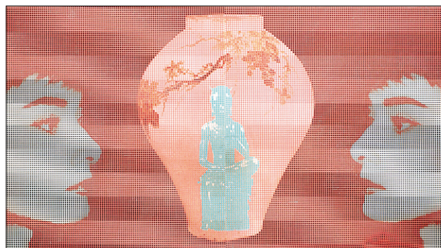
위에서부터 시계방향으로 김종식 작가의 작품 '모나리자와 반가사유상' '마주보는 오드리 햅번' '마릴린 먼로와 백자병'