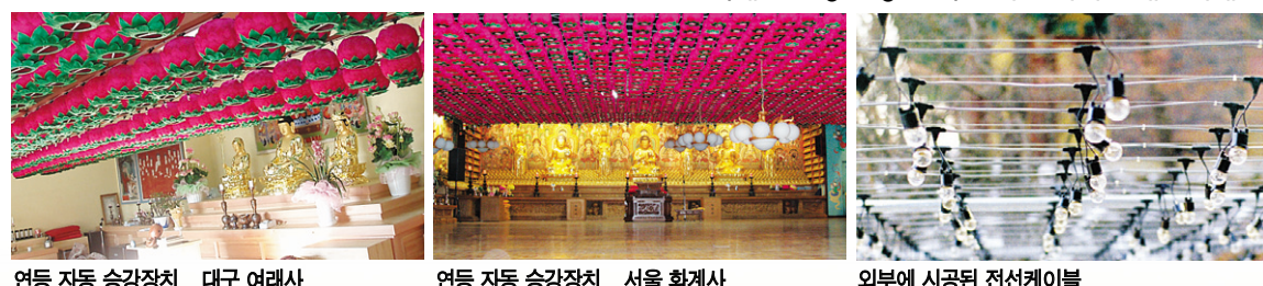
연등 자동 승강장치 _ 대구 여려사