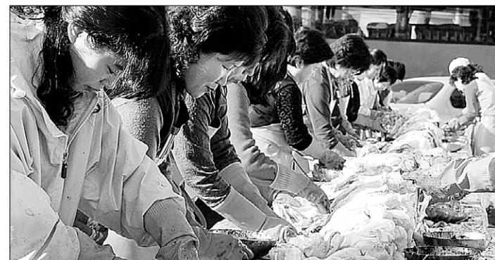
어려운 이웃들을 위해 김장을 담그는 자원봉사자들.

예년 기운을 크게 밀도는 강추위에 겨울이 성큼 다가와 불교계가 운영하는 복지시설은 월동준비를 분주하다. 특히 김장철을 맞아 홀로사는 독거어르신과 장애인, 저소득가정을 위해 김장김치를 담그거나 난방비 등을 지원하느라 바쁘지만 하다.