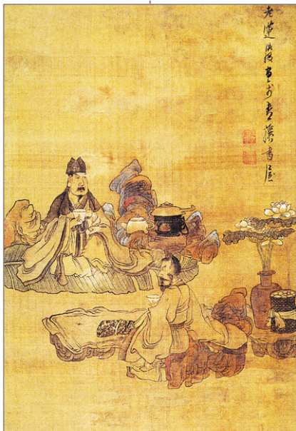
만생호(曼生壺). 중국 당나라 예술가 소장(위), 진홍수(陳洪綬), '정금품명도(淸琴品茗圖)', 견본실색, 76x54cm, 개인소장(아래).

오늘 소개하는 진홍수의 그림인 '정금품명도(淸琴品茗圖)'는 두 인물이 악기 연주와 차를 마시며 품평하는 모습을 그린 작품이다. 문인의 차회는 그림으로 흔히 접할 수 있는 소재이지만 진홍수의 표현방식은 매우 독특하다. 우선 그림 안에는 동진시대의 화가 고개지에 의해 성립된 고식의 표현방식이 눈에 띈다. 인물과 주변 경물을 제외한 모든 배경은 생략했으며 인물들의 의복 표현도 옛 방식을 따라 평면적으로 그려져 신채 골격감이 거의 느껴지지 않기 때문이다. 하지만 이 그림이 단지 과거의 전통에 머무르지 않고, 참신하면서도 희극적으로 느껴지는 이유는 바로 인물들의 얼굴표정에서 찾을 수 있다. 옷 주름의 표현보다 더욱 섬세한 붓질로 그려낸 얼굴 표정은 마치 특정인물의 초상화를 그린 듯 생생하다. 화면을 등지고 주인공과 마주앉은 인물도 정면을 날카롭게 응시하고 있는 표정에서는 깊은 의중이 읽힌다. 또한 각이진 바위 질감에 맞추어 옷 주름의 곡선 표현을 조금씩 굴절시킨 부분은 배경과 인물이 한데 어우러져 개성적 얼굴 표현을 한층 돋보이도록 만들었다. 다란을 들고 있는 인물들의 주변에는 군데군데 찢어진 파초 잎과 비단에 싸인 채석상(石床) 위에 놓인 거문고가 있어 소박한 듯 운치