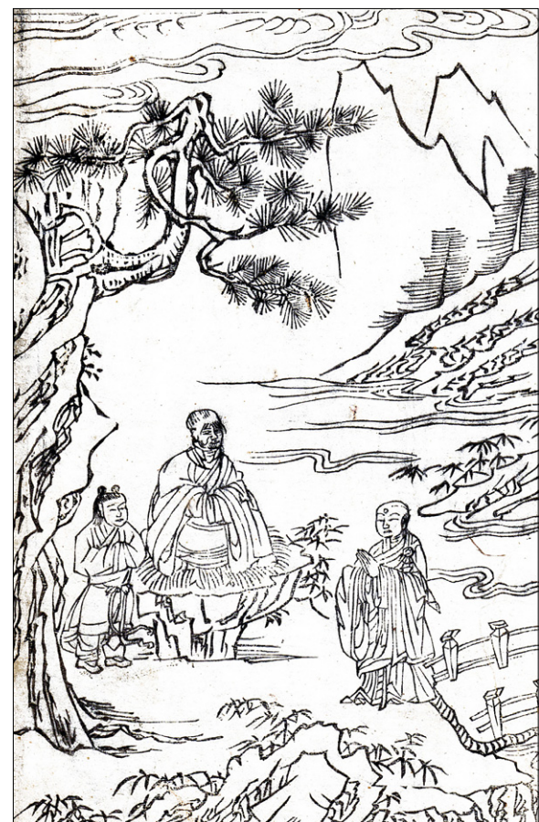
고관화박물관 소장 <석씨원류(釋氏源流)> 중 무업돈오(無業頓悟) 편. 불암사 판 1673년 간행, 반곽(半郭) 27.2×18.0cm