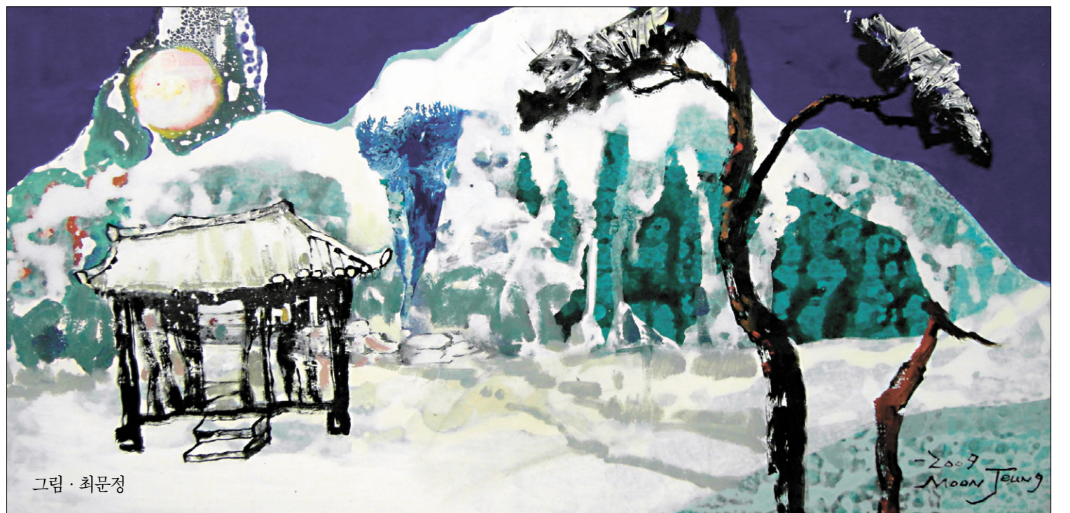
그림 · 최문정

런 마음이었으므로 한 가닥의 요령이나 잡념도 끼어들 틈이 없었다. 누구에게 칭찬받을 생각도 없었고, 무엇이 관한 것인지를 생각하지도 않았다. 자신에게 길을 열어 준 고마운 분이 시키는 일이니 무심코 할 뿐이었다. 그 사이 암자 터에 기둥과 들보가 맞추어 세워지고 상량식 때는 단에 떡과 과일을 올려졌다. 해암은 묵묵히 치며 <반야심경>을 외었다. 문수암 불사는 정 목수가 약속한 대로 첫눈이 내리기 전에 회향되었다. 그제야 해암이 원각을 불러 말했다. “너는 해인사 선방으로 돌아가거라. 나는 문수암에서 겨울을 나 처사와 함께 날 것이다.” 원각은 새 암자인 문수암에서 정진하고 싶었지만 해암이 지시하는 대로 즉시 문수암을 내려왔다. 나 처사는 해암보다 나이가 더 많았는데, 출가 수행자가 되고 싶어 문수암을 찾았은 불자였다. 은사를 두고 해인