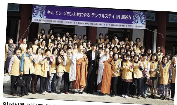
입제식을 마치고 참가자들과 함께 찍은 단체사진.

김민종은 팬미팅 자리에서 “일본에서 한국 33관음성지까지 성지순례하시는 불심 깊은 참가자들이 뜻 깊은 시간을 편안하게 보내시길 바란다. 특별한 의미를 찾는데 보다는 잠시나마 나를 돌아보고 소중한 추억을 만드는 시간이 되길 바란다”고 말했다. 그는 “한국의 불교문화와 정신문화를 전하는 의미있는 시간이다. 불교국가인 일본과 우리나라의 전통 불교문화 교류에 큰 역할을 할 것이라 생각한다. 앞으로 일본에서 활동하고 있는 많은 연예인들도 참여할 수 있는 계기가 마련되길 바란다”고 덧붙였다.