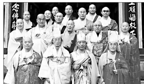
양양 동해사에서 10월 29일 봉행된 제17회 동해사 범비광명 고승보살수계 대법회에 참가한 스님들.