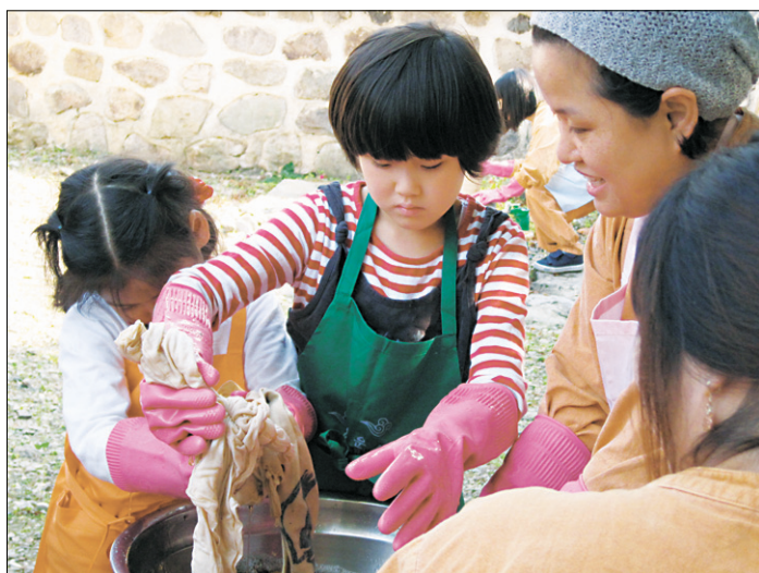
10월 23~25일 선운사에서 열린 템플스테이에 참석한 어린이가 어머니와 염색체험을 하고 있다.

아토피는 제2의 천행(天刑)이라 불릴 만큼 완치가 어렵다. 아토피 피부염으로 고통 받는 어린이들을 위한 템플스테이가 열려 눈길을 끈다.