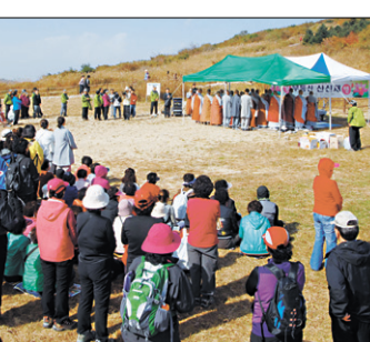
10월 21일 무등산 장불제에서 봉행된 산신제 모습.

이날 행사는 900m 높이의 장불제에서 법회와 의식과 영산재에 이은 축원의식 순으로 진행됐다. 지각 스님은 인사말에서 “무등산은 광주시민의 평온한 인식처이다. 우리 스스로 무등산을 아끼고 사랑해야 후손에게도 물려줄 수 있다”고