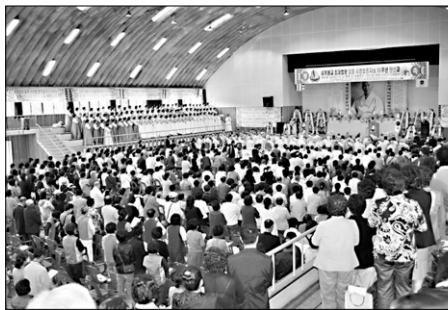
10월 10일 열린 일부문도회의의 날 법회모습.