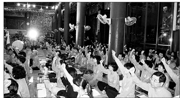
조계사 대웅전을 가득 메운 신도들이 3000배의 결의를 다짐하고 있다.