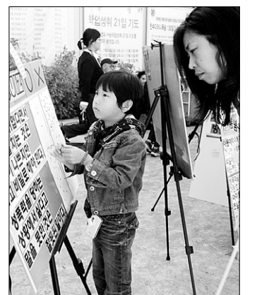
아동 성폭력 대응교육에 참여하고 있는 어린이.