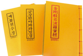
금지경전 세트 (3권+주머니) @25,000원(10세트이상) *후대양구시 전화주십시오