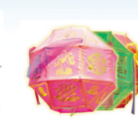
비단집동 12cm @2700원(100개이상)