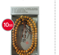
주목 백발주 @10,000원(10개이상)