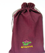
금지경전 3권과 주머니형태 @14,000원(10세트이상)