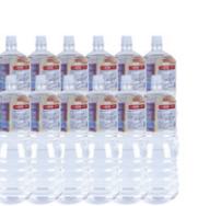
파라판양초(1.8 l 12봉) @50,000원