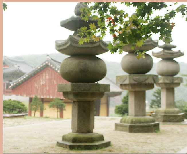
주인을 알수없는 조선시대의 부도가 매우 독특한 형상이다(왼쪽). 해소국사 탐비 이수 및돌 해체된 채 보관 '화려함과 기상' 어리는 듯 벽응대사 행적비 독특, 부도는 없고 사리공만