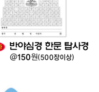
반야심경 인문 탐사경 @150원(500권이상)