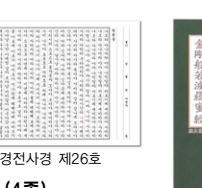
한지 108사경 (4종) @14,000원(100권이상)