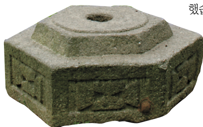
벽응대사 사리탑으로 보이나 몸돌은 없다.

벽응대사는 1576년 경기도 죽산에서 출생해 13세에 출가했습니다. 맑은 성품으로 선과 교를 두루 수행했으며 금강산과 지리산 묘향산과 구월산 등 팔도의 명산들을 유력하며 정진의 끈을 놓지 않다가 만년에 칠현산에서 입적했습니다.