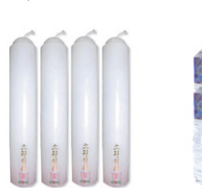
일반일대(1Box 70개) @77,000원