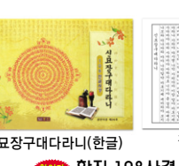
경전사경 제26호 @1,500원(100권이상)