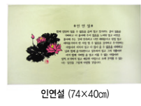
인연설 (74x40cm) @4,200원(100권이상)