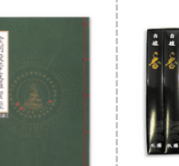
금강경 인문사경 @3,500원(50권이상)