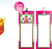
PVC 집게투표(100매) @20,000원