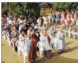
효봉 스님 제43주기 추모제 모습.

조계종 초대 종정을 역임했던 효봉 스님 43주기 추모제가 순천 송광사에서 봉행됐다.