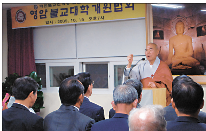
10월 15일 영암불교회관에서 열린 영암불교대학 개원식에서 조계종 중앙종회의장 보선 스님이 법문하고 있다.

보선 스님은 법문에서 “믿음과 수행은 늘 같이 해야한다”며 “부처님 법은 ‘귀 있는 자는 와서 들어라’라는 말씀처럼 와서 배우고, 깨달아야 그곳이 극락세계”라고 강조했다. 이어 스님은 “이곳 불교대학은 믿음과 깨달음을 시작하는 장소가 돼야한다. 배우는 자는 하