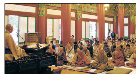
10월 17일 장수 죽림정사에서 봉행된 백용성 조사 오도 제123주년 기념 다례제 모습.

3·1독립운동 민족대표 33인 중 불교계 대표인 백용성 조사(1864~1940)의 탄생지인 장수 죽림정사(주지 법륜)에서 ‘백용성 조사 오도 123주년 기념 학술세미나와 역대 조사 스님들의 다례제가 봉행됐다.