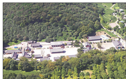
고창 선운사 전경.