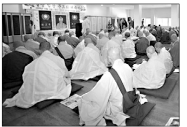
10월 10일 열린 일불법왕문도의 날 법회

일불법왕문도회가 주최하고 일불법왕종이 주관하는 일불법왕문도의 날 기념식 및 일불법왕 조사전 기공식 대법회가 10월 10일 오전 11시 충북 청원군 법왕정 담화정사에서 봉행했다.