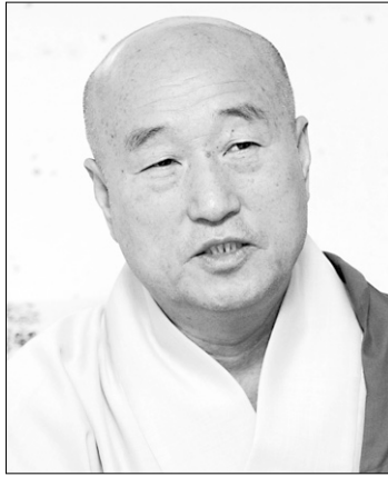
생명나눔실천본부 이사장 일면 스님

“한 분의 기증으로 수십 명의 고통 받는 이웃에게 삶의 희망을 나눠 줄 수 있습니다. 여러분도 생명나눔에 동참하세요.”