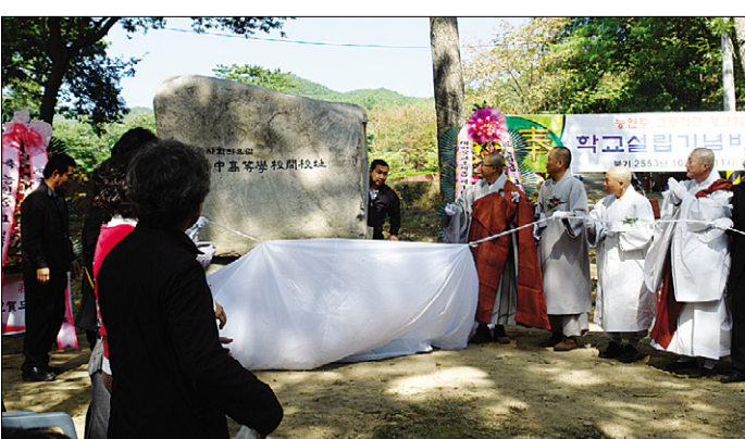
10월 9일 능인중·고교 개교 70주년을 맞아 은해사 백련암 앞에 건립된 학교 설립기념비 제막식 모습.

종립학교인 능인중·고교가 개교 70주년을 맞아 학교 설립 기념비를 제막했다. 학교법인 능인학원(이사장 종광)은 10월 9일 은해사 백련암 앞에서 학교설립비 제막식을 봉행했다. 설립비는 전면에는 '능인중·고등학교 설립비'를 한문으로 새겼고, 후면에는 학교의 건략한 역사를 기록했다. 종광 스님은 축사에서 "능인중·고교는 일본강점기 당시 불교 선각자들이 민족정신을 지키고자 설립한 호국사상이 깃든 교육의 현장"이라며 "설립비 제막을 계기로 능인학원 설립의송고한 의미가 널리 알려