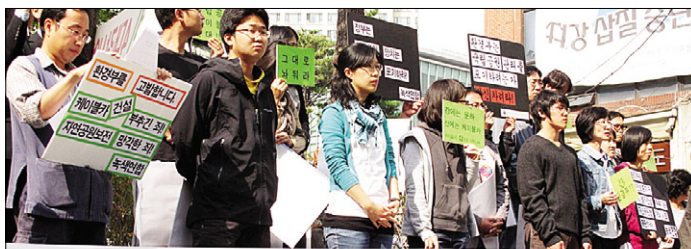
케이블카반대위는 10월 12일 조계사 앞에서 열린 기자회견에서 “우리의 자연을 그대로 두라”고 주장했다.

‘국립·도립·군립공원 안 관광용 케이블카 반대 전국대책위원회(이하 케이블카반대위)’는 10월 12일 서울 조계사 앞에서 케이블카 추진 자연공원법 개정 반대 기자회견을 가졌다.