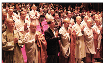
불교환경연대의 첫 후원의 밤 행사가 300여 대중의 축하와 격려로 여법하게 봉행됐다.

불교환경연대(상임대표 수경)가 지난 10년을 돌아보고 앞으로 10년을 준비하는 후원의 밤 행사를 10월 14일 한국불교역사문화기념관 공연장에서 개최했다.