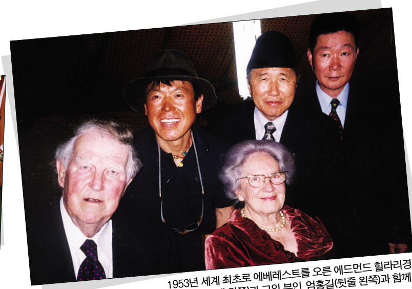
1953년 세계 최초로 에베레스트를 오른 에드먼드 힐러리경(맨 왼쪽)과 그의 부인, 임홍길(뒷줄 왼쪽)과 함께.