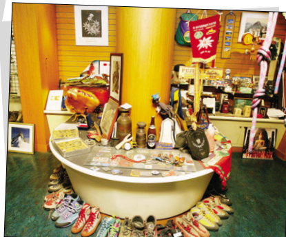
산악박물관의 한 코너.