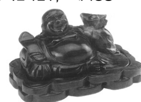
흑단목포대화상향로 (대) 26 × 16 × 16cm 125,000원 → 할인가 125,000원

예술조각품으로 보는 것만으로도 마음이 편안해지고 있는 사람과 만날 수 있는 이덕과 복판을 마음을 이루어 주며 입에서 향이 뿜어져 나와 예술시에도 사용됩니다.