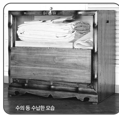
수의 등 수납한 모습