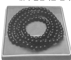
흑단목108염주 단주 흑단목염주 / 흑단목염주천주 크기 : 8mm × 10mm × 12mm 55,000원 10mm × 10mm × 12mm 65,000원 12mm × 10mm × 12mm 85,000원 흑단목염주는 기원이 자랑하여 보시용으로 많이 사용됩니다.