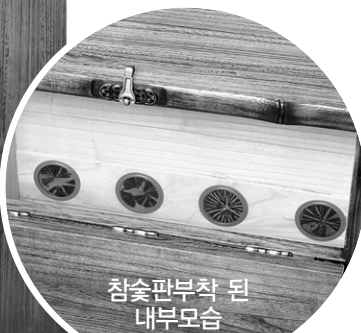
참숯과부착 된 내부모습