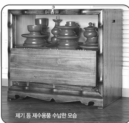
제기 등 제수용품 수납한 모습

주의!! 사람장 큰 충격을 주지 마세요, 사용하기 전 7일 이내 반쯤 가능합니다.