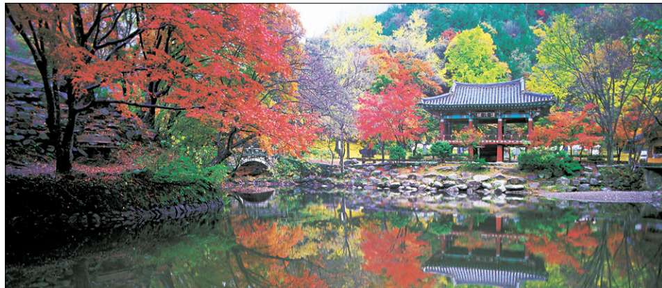
장성 백암사 여기가 하늘이고 여기가 물인지, 경전 속의 모든 말씀이 풍경 속에도 있는 듯하다.