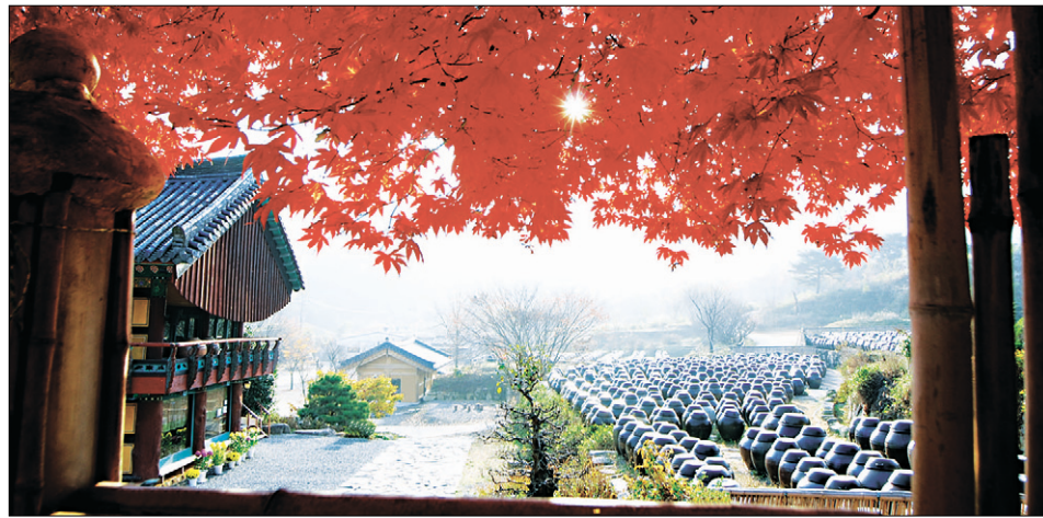
통도사 서운암 서운암의 장독대는 유명한 풍경이다. 서운암의 장막 또한 유명한 풍경처럼 유명하다. 붉게 물든 단풍잎 위로 가을이 쏟아지고 있다.