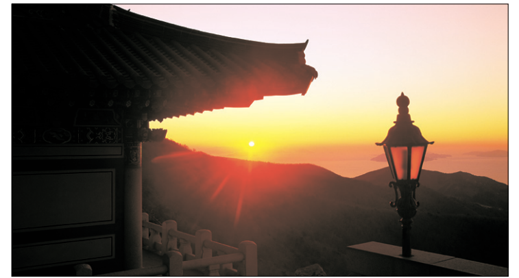
남해 보리암 기다림에 대한 대답처럼, 희망의 확인처럼 붉은 태양이 보리암으로 쏟아져 들어온다. 오 늘도 희망을 담아가고 싶은 중생의 발길이 이어진다.