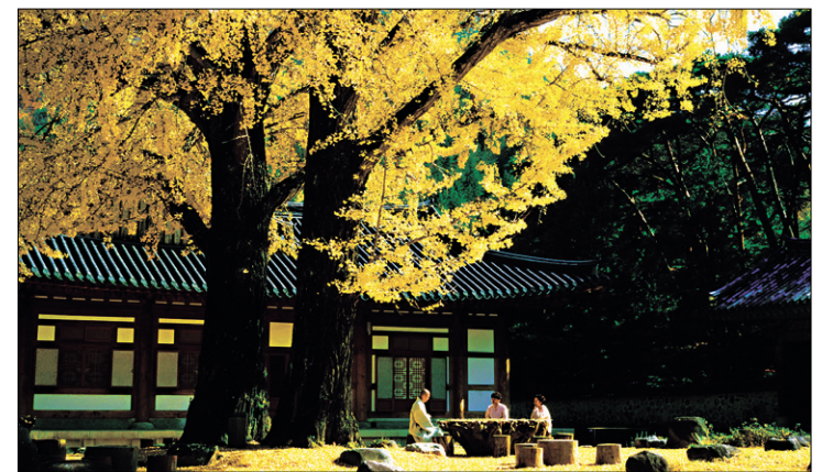
청도 운문사 손님 발상처럼 깨끗하게 치려져 있는 도량 운문사. 스님과 불자들이 노란 은행잎을 깔고 가을 이야기하고 있다.