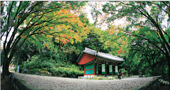
선운사 도솔암 도솔천에도 가을이 찾아왔다. 서쪽 바위에서는 미륵부처님이 도량을 내려다보고 있다. 도솔암의 풍경은 늘 신비롭다.