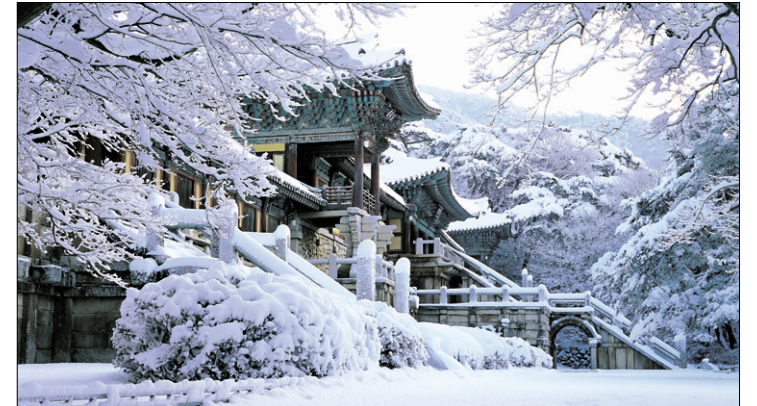
경주 불국사 사진을 보는 것만으로도 관람료를 지불해야 할 것 같은, 풍경 중의 풍경이다. 사진에서 보는 것처럼 늘 같은 자리다.