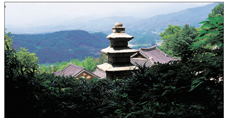
영주 부석사 사연 많은 부석사. 삼층석탑도, 부랑수전 지붕도, 저 멀리 보이는 소백산 봉우리들도 모두 부석사의 한 가지 사연 같다.