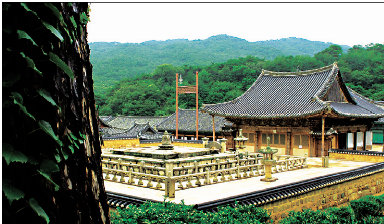
양산 통도사 이름만으로 풍경이 되는 도량 통도사. 불보사찰 통도사의 풍경은 든든하고 묵직한 풍경이어서 항상 좋다.