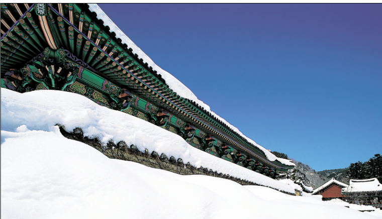
설악산 신흥사 겨울잠을 자는 동물처럼 도량은 하얀 눈 속에서 꼼짝도 않고 있다. 우리 땅 대표 풍경인 설악산의 풍경 속에 늘 도량의 풍경을 보여주고 있다.