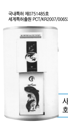
국내특허 제0751485호 세계특허출원 PCT/KR2007/006534