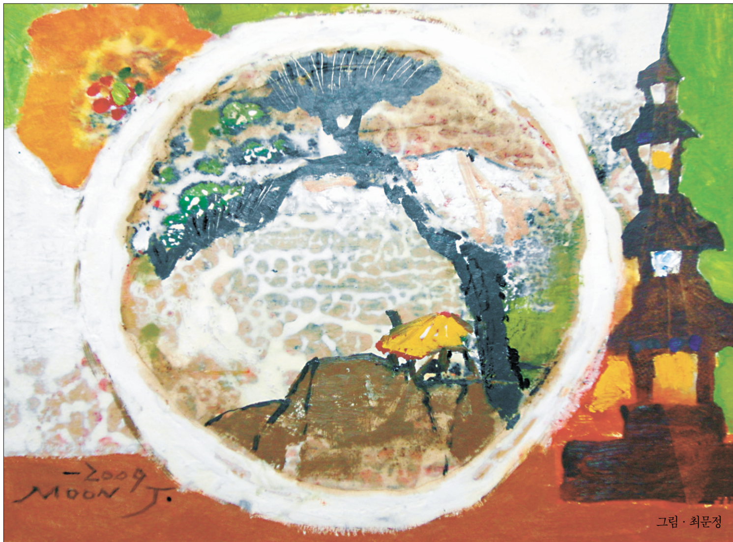
그림 · 최문정

<부처님께 귀의합니다. 그 동안 염불공부 잘해서 죽을 때에 귀신들에게 끌려서 삼악도에 가지 아니하고 극락세계의 아미타불 회상으로 가실 자신이 있습니까. 모진 병 앓고 똥이나 싸고 정신없이 집귀신