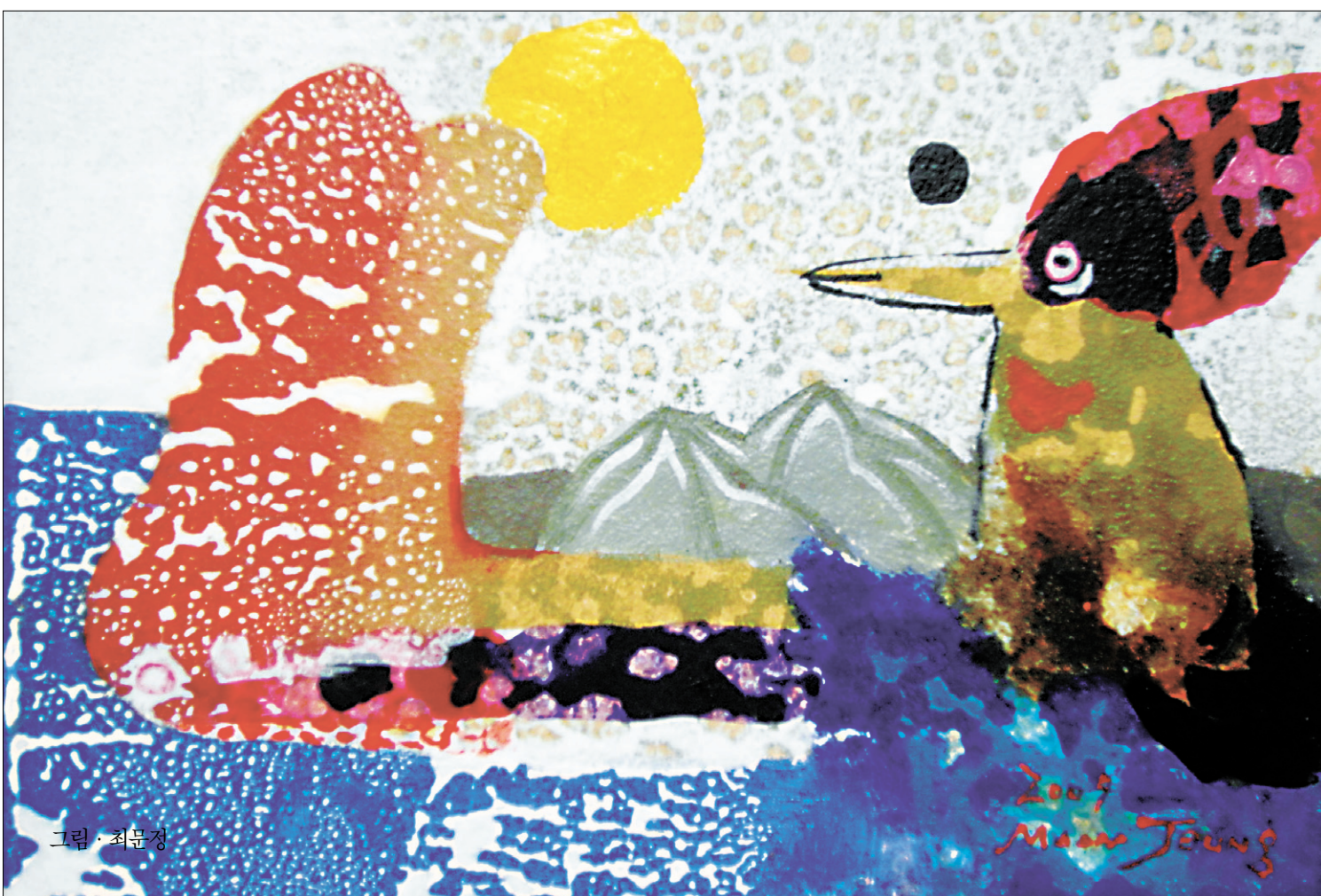
그림 : 최문경

“참선을 해야 산 중이시.” 해암스님이 장좌불와를 하기 때문에 성법도 잠을 자지 못했다. 해암스님은 가만히 앉아 좌선만 하는 것이 아니라 찾아온 제자에게 밤새 설법을 했다. 성법은 뜬눈으로 밤을 새우며 설법을 들었다.