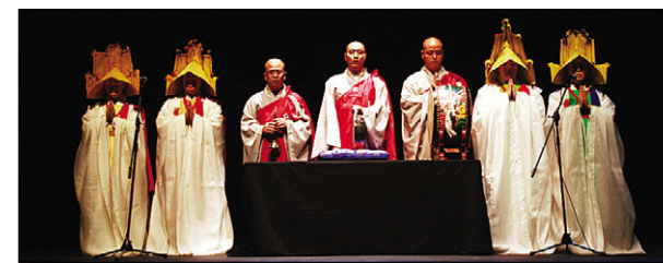
동국대 문화예술대학원의 '범패'의 한 장면.

불교음악 인재들을 활용, 불교계의 문화마인드를 높이기 위해 동국대 동문과 재학생들이 한마음으로 뭉쳤다.