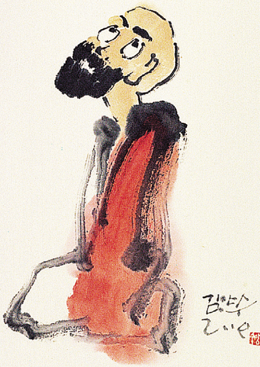
김양수 화백의 달마도는 제목이 없다.