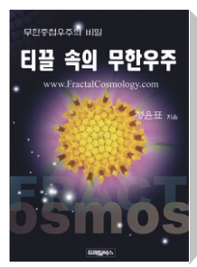
티끌 속의 무한우주 | 정운표 지음 | 프랙탈북스 | 1만5000원

“한 티끌 그 가운데 시방세계 머금었고(一微塵中 含十方) 일체의 티끌 속도 또한 다시 그러해라(一切塵中亦如是) 끝이 없는 무량겁이 곧 일념이요(無量劫即一念) 일념이 곧 끝이 없는 겁이여라(一念即是無量劫).”