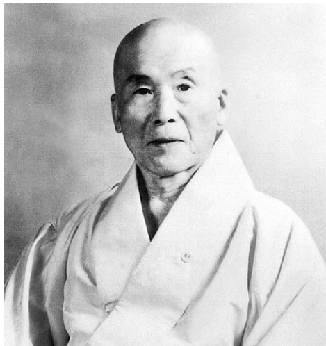
세계법왕 일봉 서경보 존자

세계불교법왕청 초대법왕 일봉 서경보존자님의 국내외 6천7백명의 제자로 구성된 전국일봉문도회