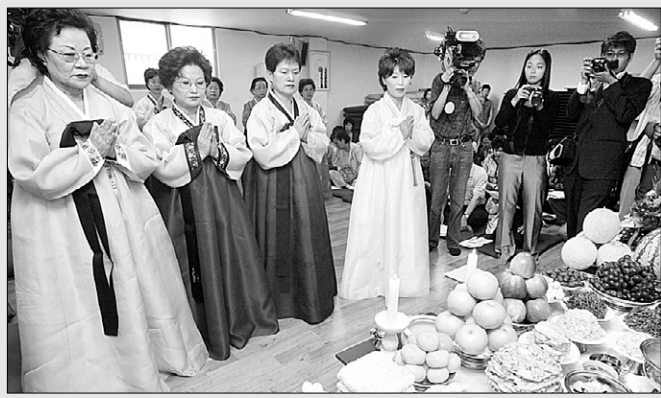
서울 열린선원에서 일반 재가자들이 합동 차레를 지내는 모습. <현대불교 자료사진>

영월 법흥사(주지 도완, 033-375-9173)는 수확의 기쁨을 맛볼 수 있는 특별한 템플스테이를 마련했다. 10월 2-4일 '꿈을 이루려는 사람들의 추석맞이 템플스테이'에서는 법흥사 일대 사과 밭 사과를 직접 수확하고, 합동 차레로 조상에 대한 감사의 마음을 나눈다. 또 스님과 함께하는 차담, 법흥계곡에서 달맞이 경기 등 풍성