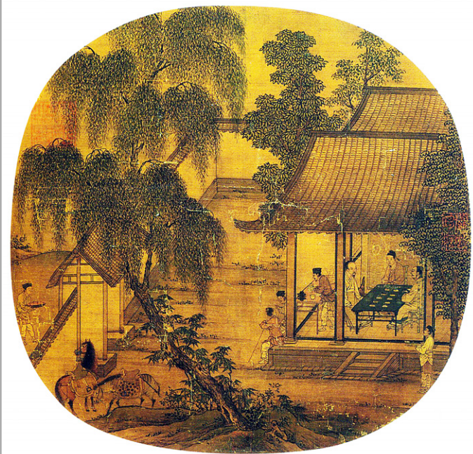
작자미상, '문회도', 22.6x23.8cm, 비단 위에 채색, 남송시대, 대북고궁박물관 소장.

본이 가지런히 놓여있다. 그 원인으로 차를 준비하는 또 다른 탁자에는 청자다완(靑瓷茶碗)과 흑침다탁(黑漆茶托) 3세트 그리고 다병(茶瓶)이 놓여있고 시동은 점다(點茶)를 준비하고 있다. 그림 속의 문인들은 아마도 요란함을 싫어하고 단정한 성품을 지닌 듯, 탁자에는 흔히 쓰이는 술도 보이지 않는다. 게다가 차색을 도드라져 보이게 하는 검은빛의 흑유다완 대신 청자다완을 사용하는 것으로 보아 차의 색과 모양을 애써 겨루는 투차(鬪茶)도 할 생각이 없는 듯하다. 문화의 성격에 따라 다안을 달리 사용