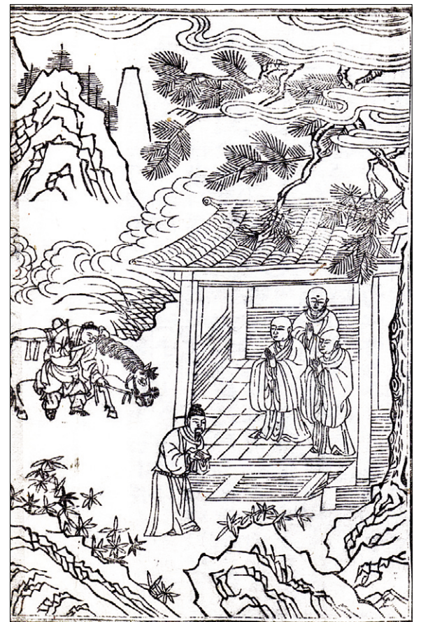
고관화박물관 소장 <석씨원류(釋氏源流)> 중 배휴증시(裴休贈詩) 편, 불암사 판 1673년 간행, 반격(半幅) 27.2×18.0cm

가자고 재촉했다. 회운 스님은 건너가고 싶으면 혼자 건너가라고 말했다. 그 스님은 평지를 가는 듯 조금도 물에 젖는 것이 없이 물을 건너 회운 스님을 부르는 것이었다. 이에 회운 스님이 말했다. '스스로 깨달은 척하는 놈! 내가 일찌감치 알았다면 반드시 너의 정강이를 부러뜨렸을 것이다.' 그러자 그 스님은 찬탄했다. '진실로 큰 법기르다. 나는 미치지 못한다.' 이 본문의 내용을 중국학자 오경웅은 선학의 황금시대에서 이렇게 새겼다. "우리가 우리 안에 있는 심체를 얻으려면 사소한 마음의 집착을 없애야 하며, 혹은 적어도 그것을 중요하게 여겨서는 안 된다. 그것들은 진정한 지혜의 샘솟는 원천으로부터 우리의 주의력을 흘뜨려 놓기 때문이다. 그래서 황벽의 일심(一心)이라고 하는 것은 무심(無心) 바로 그것이다. 우리가 근본 마음-심체(心體:fundamental Mind)로 돌아갈 수 있는 것은 이 무심을 통해서다." 이러한 무심의 세계를 가기 위해 수행 정진했던 황벽 선사의 시 "뺨을 깎는 주위를 한 번도 만나지 않았던들 어찌 매화가 향기를 얻을 수 있으리오"라는 박비향(僕鼻香)이 생각나는 시간이다. 선학 스님(명주사 고관화박물관 관장)