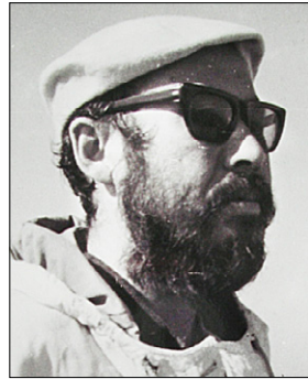
해안 서경수 거사.