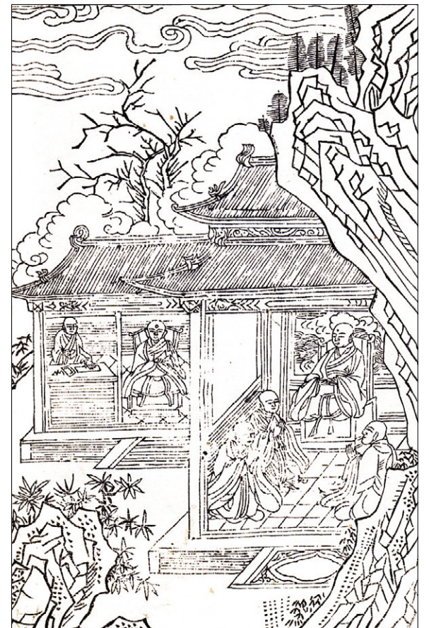
고관화박물관 소장 <석씨원류(釋氏源流)> 중 신인사지(神人捨地) 편. 불암사 판 1673년 간행, 반각(半郭) 272×18.0cm