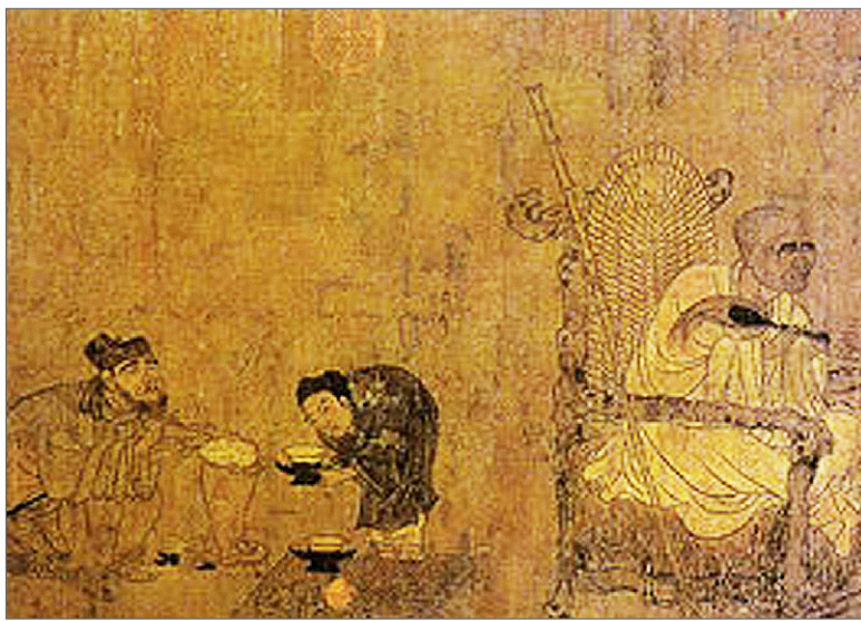
전 염립본(關立本, ?-673), <소의잠난정도>, 비단에 채색, 27.4x64.7cm, 대북고궁박물관 소장.

당시에 사찰에서는 어떤 방식과 과정을 통해 차를 마셨을까. 대북고궁박물관에는 당대에 사찰에서 손님을 맞아 차를 마시는 장면을 그린 작품 한 점이 전해지고 있다. <소의잠난정도(蕭翼賺蘭亭圖)>는 궁정 화원으로 활동한 염립(顏立)의 그림을 송대의 화가가 모사한 작품이다. 그림은 사찰의 다법을 보여주는 진귀한 자료로 내용은 하연지(何延之)의 <난정기(蘭亭記)>에 기록된 역사적 사실을 재현하고 있다. 이야기에 따르면 동진(東晉)시대 서법의 대가 왕희지는 40여 명의 친구들과 함께 지금의 중국 소흥(紹興)지방의