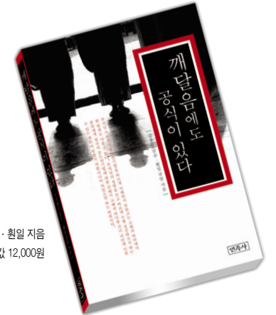
김종수 김수·원일 지음 신국판 / 296쪽 / 값 12,000원

“ 괴로움에서 벗어나고자 열망하는 사람 누구에게나 깨달음으로 가는 이정표! ”