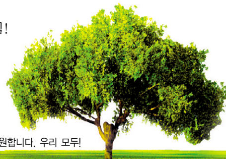
※부처님 말씀을 통하여 행복과 평화를 가져오기를 발원합니다. 우리 모두!