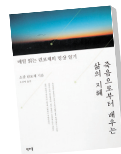
죽음으로부터 배우는 삶의 지혜 소갈 린포체·오진탁 판미동 1만7000원

하루하루 자신을 돌아볼 수 있는 명상 실천서로 손색이 없다. 김성우 기자