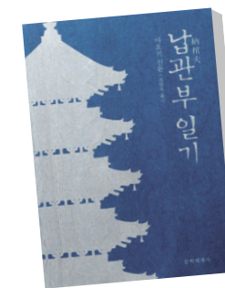
남관부 일기 아오키 신문·조양욱 문학세계사 1만원

하고 사후 세계로 갈 수 있게 돕는 사람’이라고 말한다. 날마다 시신을 마주하면서 생과 사를 진지하게 되묻는 저자는 남관부 일을 계속해오던 중 알지 못하던 편안한 삶의 시심(詩心)을 깨치게 된다. 그리고 “깨달음이라는 것은 어떠한 경우에도 태연하게 죽는 것이라고 여긴 것은 잘못이었고, 깨달음이라는 것은 어떠한 경우에도 태연하게 사는 것이었다”는 말을 체득하게 된다. 김성우 기자